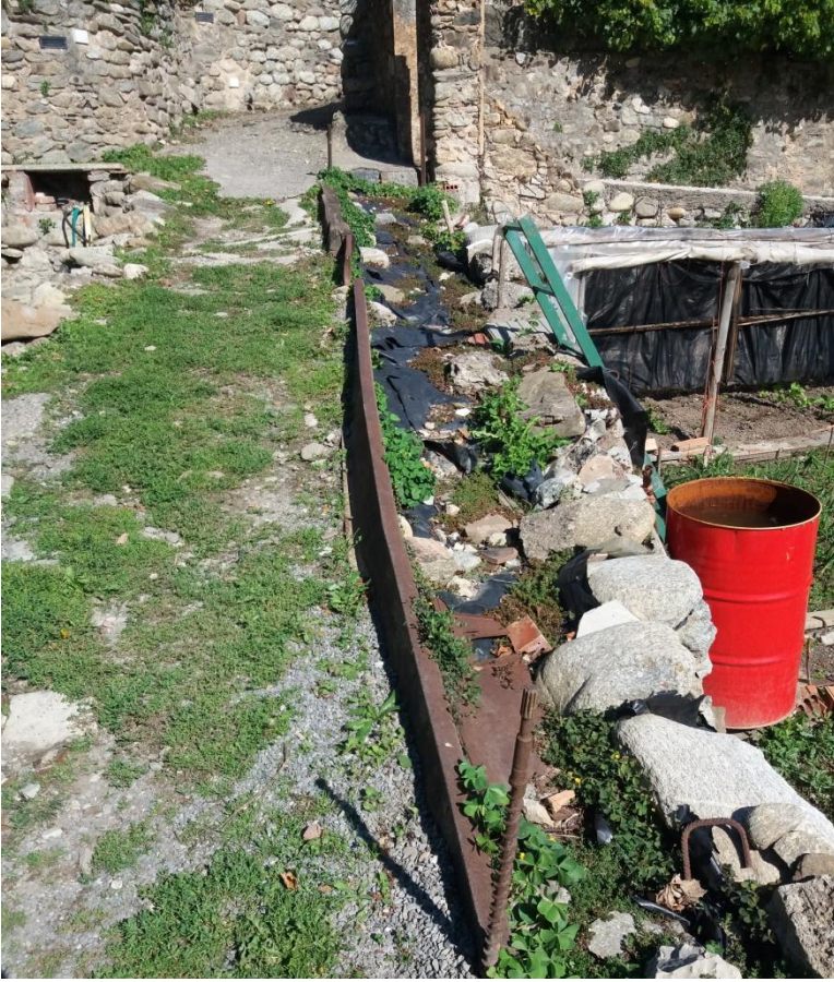
Sant Joan de les Abadesses, 30 d'octubre de 2020