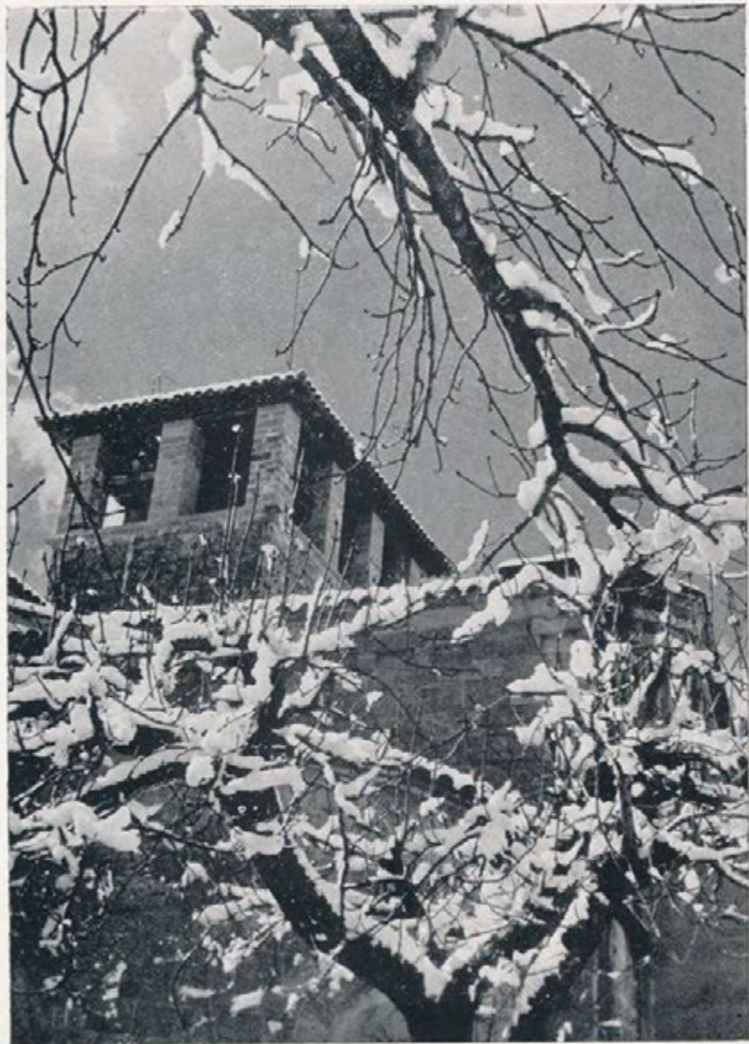
Escrutante atalaya monacal... inverniza flor de la Historia.