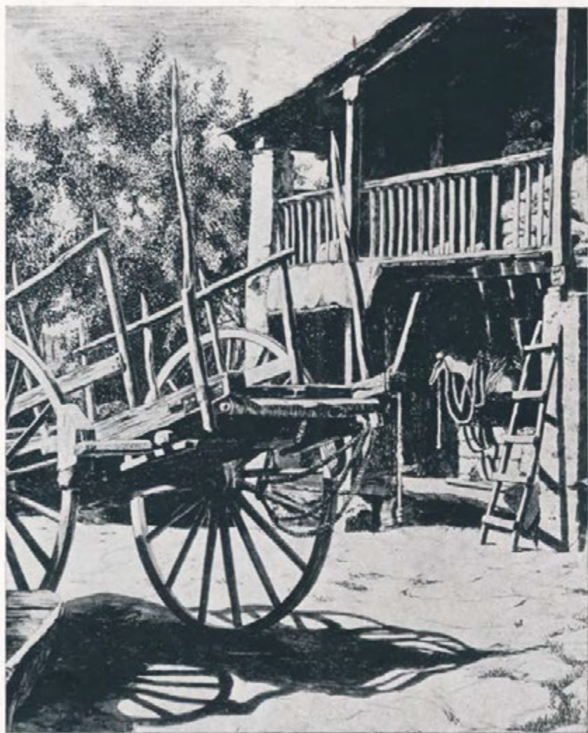
Dibujo de A. Alcáide