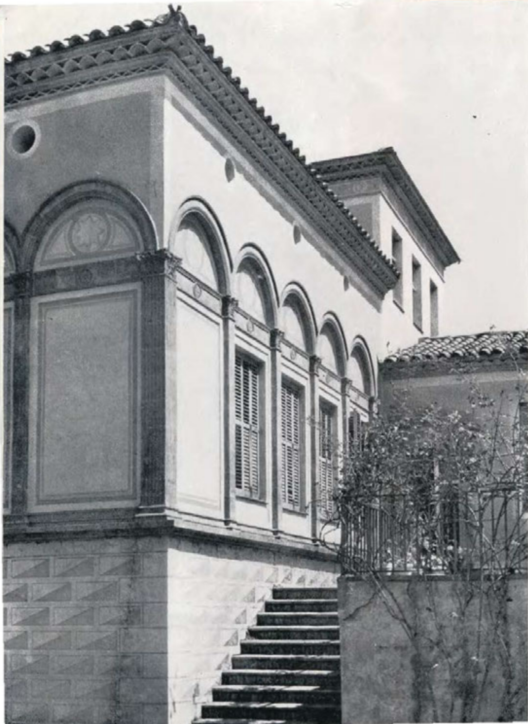
Raimon Duran i Reynals ha sabut encaixar en el nostre paisatge les més delicades formes de l'arquitectura florentina.