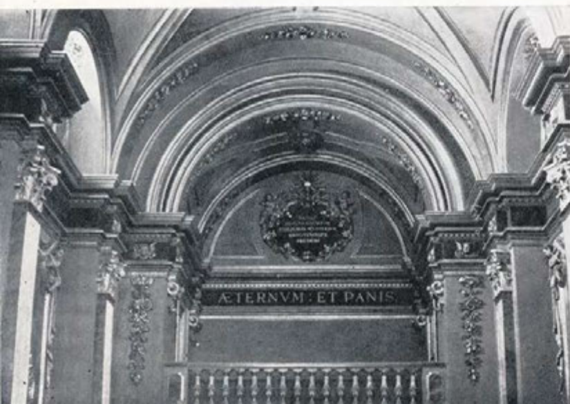
Detall de la Capella dels Dolors

La data consignada al costat de cada un dels edificis enumerats, correspon a l'any de l'acabament de les obres.