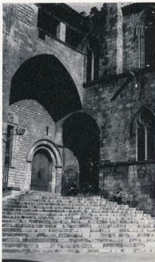
Palacio Real Mayor en la Plaza del Rey de Barcelona, con la escalinata de acceso al Tinell o gran sala de recepciones.

A pesar de que nada se conoce de la vida de Socarrats, juristas, magistrados y estudiosos de nuestro siglo, consultan y citan su obra: Brocá, Maspons y Anglasesell en Principios del Derecho Público Catalán , don Carlos Obiols y Taberner en Jurisprudencia Civil Andorrana , Francisco Elías de Tejada que de su libro El Pensamiento Político Catalán , entresacamos estas líneas: