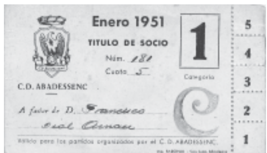
17. Carnet de soci de l'any 1951