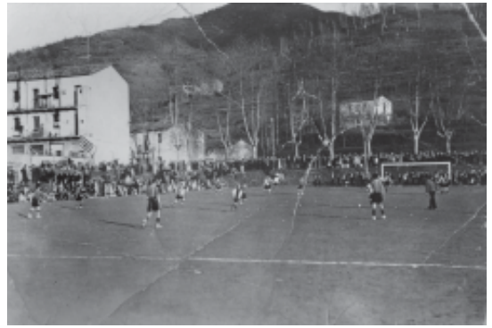
6. Temporada 1933-34. Disputa d'un partit al Manigosta.

En els anys post-guerra, es creen diversos equips de futbol a la nostra vila. En destaquen l'equip de "La Plaça", "La Penya Paperina", "Educación y Descanso", "Acció Catòlica"... (Fotos 9, 10 i 11) Es jugaven molts partits amb altres equips de la comarca. Gràcies a aquests partits, l'afició al futbol anava creixent. És l'època en què els soldats que estaven destacats a la