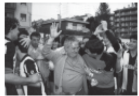
63. Celebració, l'any 1987, de l'ascens a Regional Preferent i foto commemorativa de la jornada històrica.