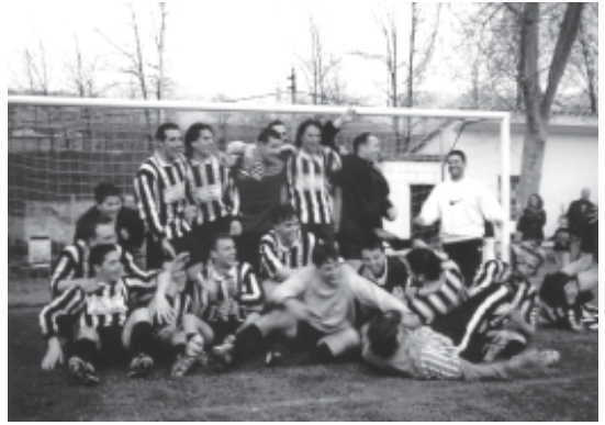
73. Temporada 2003-04. Celebració de l'ascens a Primera Regional.