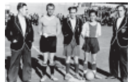
Temporada 1935-36. Kick off d'un partit celebrat l'any 1935.