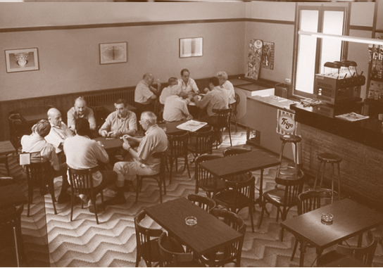
Can Passolas, casa de menjars a l'avinguda Comte Guifré; interior del Bar Centre, al passeig Comte Guifré

Aquest àmbit laboral i industrial, està marcat per vagues i molta inestabilitat. Les fàbriques tèxtils i de ciment, especialment, no tenen una temporada tranquil·la. L'escassetat de materials i alguna vaga de transport de ferrocarril provoquen aquestes tibatons entre treballadors i industrials. L'ambient prebèl·lic i la pròpia primera guerra mundial no ajuda a asserenar els ànims: el tancament de fronteres fa caure el trànsit de mercaderies.