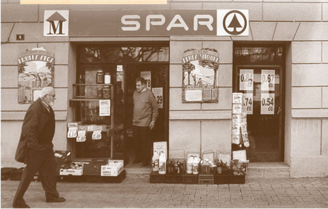
Exterior del supermercat Miquel al Passeig Comte Guifré; exterior del forn i botiga de roba "Novedades Mercè", al carrer Beat Miró.

però sempre anunciant-se amb el nom del botiguer. La marca, el logotip o una identificació gràfica de cada botiga no existeix. No serà fins després de la guerra civil que s'utilitzaran aquests recursos. Fent recerca entre els programes, activitats de la vila, fulletons publicitaris ..., la imatge gràfica és totalment inexistent i la botiga no es distingeix en res de les altres, no hi ha cap distintiu identificatiu. A la dècada del quaranta, fins i tot, es pot trobar que tota la publicitat de les botigues tenen un mateix tipus de lletra. El que ven és el nom del comerciant. Aquest fet canvia pels volts dels seixanta quan, cada botiga, comença a tenir un logotip i una imatge gràfica que l'identifica plenament i la fa diferent de la resta. La tendència arriba fins als nostres dies.