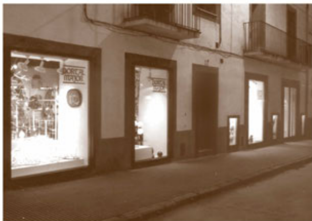
Exterior de Fotografia Esteve, al carrer Major; exterior de "Portal Major" al passeig Comte Guifré i detall interior de "Novalium", al barri de l'estació, exemples de conservació de patrimoni; perspectiva actual del carrer Pere Rovira.