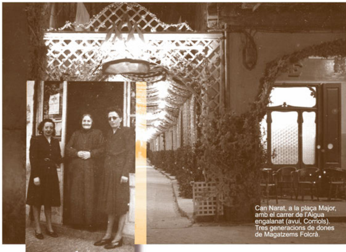
Can Narat, a la plaça Major, amb el carrer de l'Aigua engalanat (avui, Corriols). Tres generacions de dones de Magatzems Folcra.

l'Ajuntament) dibuixen un panorama difícil per a la bona marxa de petits negocis i la seva supervivència. També, les fallides constants d'organismes municipals fan encara més inviable qualsevol negoci. I si els proble-