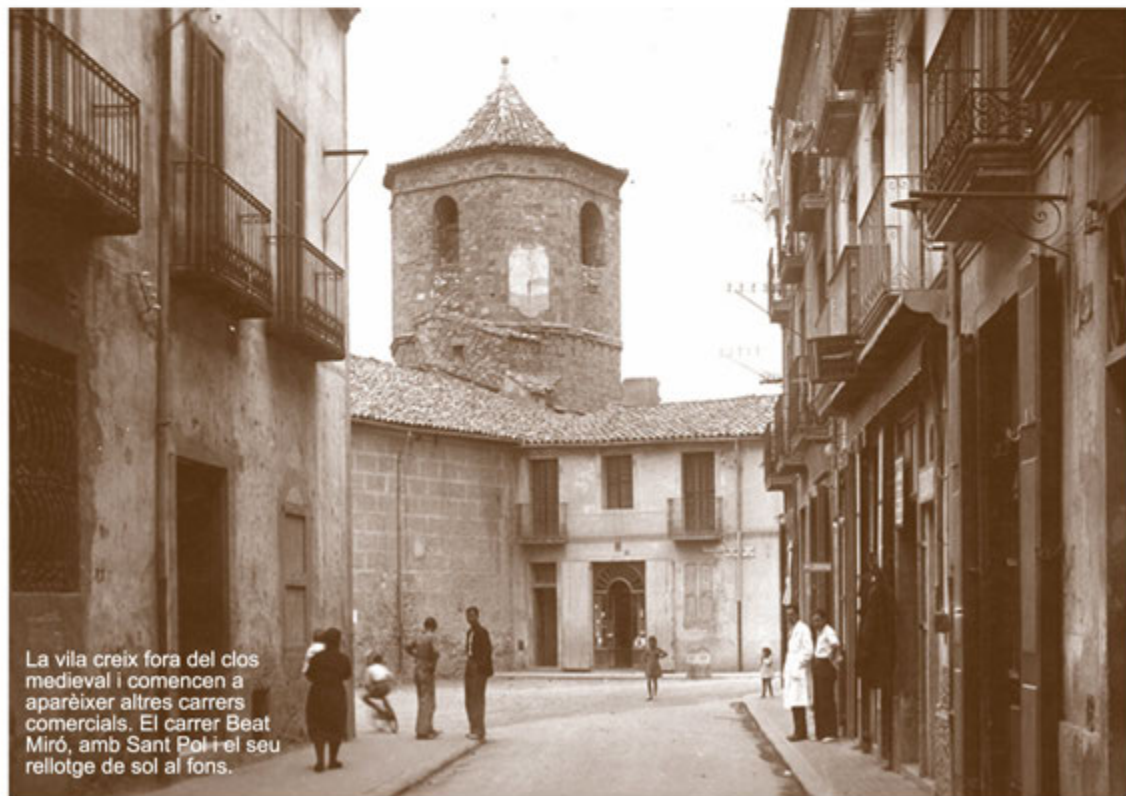
La vila creix fora del clos medieval i comencen a aparèixer altres carrers comercials. El carrer Beat Miró, amb Sant Pol i el seu rellotge de sol al fons.

El setembre de 1632, el consell Jurat concedeix un crèdit de 200 lliures per a la compra de blat per diversos