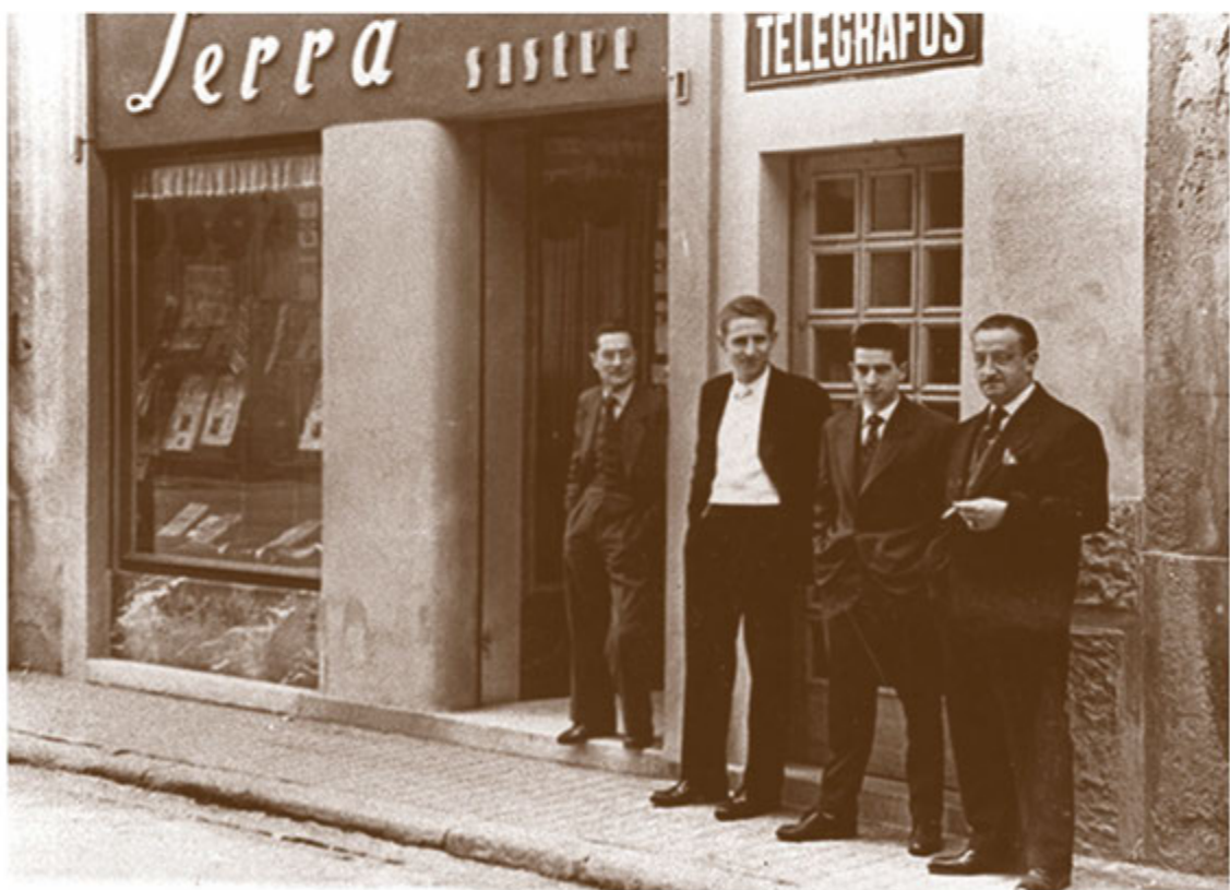
Un altre exemple d'aparador modernista de Casa Salvadó, a l'avinguda Comte Guifré; sastreria Serra al Carrer Comella.

Ja, a finals dels vint fins l'inici de la guerra civil, aquest panorama canvia: tenim anys de molta esplendor. Les grans festes d'aniversari de la Troballa del Santíssim Misteri del 1926 col·loquen a la vila com a destí referent de tot Catalunya: els dies 17 i 18 de juliol, dates claus del centenari, se celebren 27 misses! Els pelegrins que s'acosten a Sant Joan fan que el comerç tingui mesos de bonança. A més, són anys que tots els negocis rutllen i a cada porta hi ha una botiga. Els locals són buscats i hi ha escassetat per trobar-ne algun de lliure. El lloguer ascendeix entre 8 i 10 pessetes per local i pis. En l'àmbit turístic, la Font de la Puda també és un reclam pels visitants i s'inaugura un hotel a Can Peret.