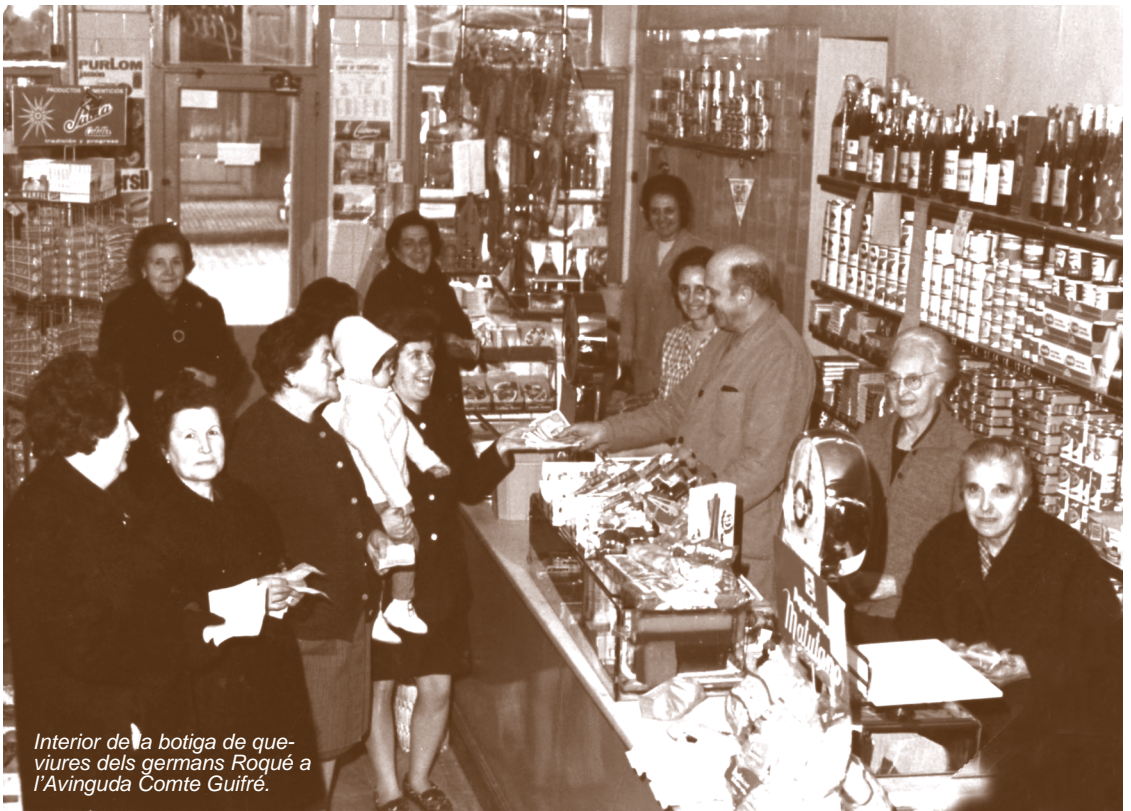
Interior de la botiga de que- viures dels germans Rogué a l'Avinguda Comte Guifré.

Aquests anys encara estan marcats per la poca liberalització del comerç i mercaderies. El repartiment de con- sum i les restriccions de productes era habitual i essencial. Fins entrats els anys vint, les notícies que tenim de la vila no són gaire alegres.