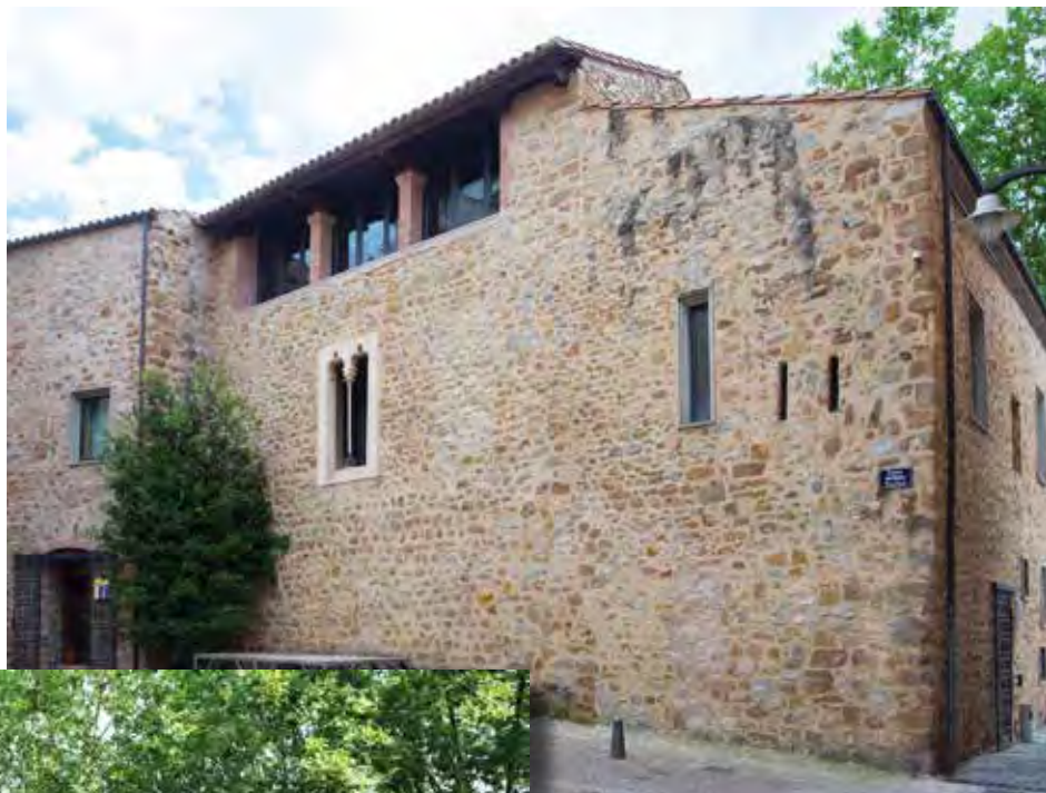
Palau Abacial (1986-2008)

Quan el sociòleg i pensador Zygmunt Bauman 9 va reflexionar sobre la transformació del concepte d'utopia en una època d'incertesa, fent referència al món contemporani, va definir la transformació del concepte en les diferents etapes premoderna , moderna i postmoderna , des de la creació del terme el segle XVI per Sir Thomas More fins a les posicions més apocalíptiques que auguraven "la mort de la utopia" o "l'esvaïment de la imaginació utòpica". Bauman, que va utilitzar la metàfora de la figura del jardiner per definir les pràctiques utòpiques modernes , va escriure: