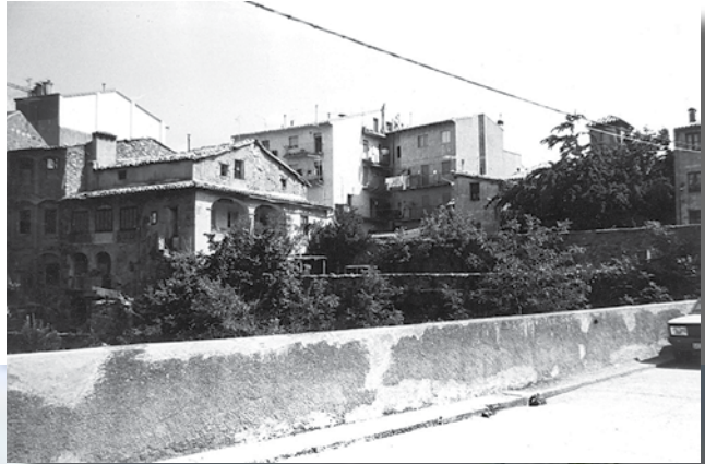
"El Palmàs". Casal Social Jaume Nunó (2008)