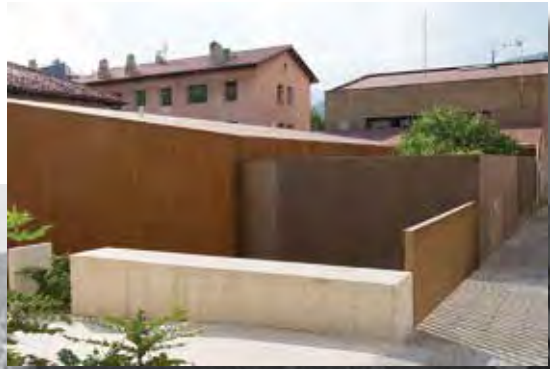
Centre d'Atenció Primària

Ús actual: equipament social : habitatge social per a gent gran.