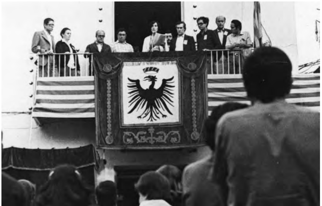
11 de setembre de 1979. La celebració comarcal a Sant Joan de les Abadesses va comptar amb la presència de tots els alcaldes de la comarca". Imatge publicada a la revista "El Ripollès. Revista de les valls del Ter i el Freser. Any 3. N. 64. 22 de setembre de 1979". p. 5.

En la mort, per atemptat del grup terrorista ETA el 20 de desembre de 1973, del president del Govern espanyol, l'almirall Luís Carrero Blanco, alguns hi han volgut veure l'inici de l'anomenada transició pacífica del règim dictatorial. Aquest fet comporta un enduriment de les accions d'un règim caduc que va fer que s'executessin les sentències de mort a Barcelona del llibertari Salvador Puig i Antic l'any 1974 i de tres militants del FRAP i dos d'ETA l'any 1975, sentències que Franco havia signat a pesar de les peticions de clemència que