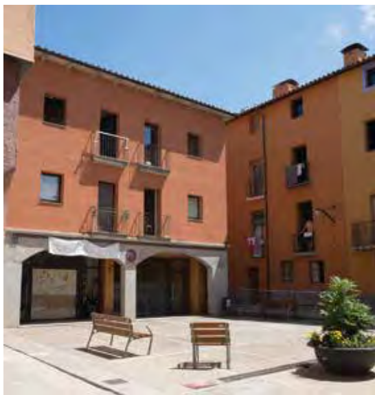
Pla Especial de Protecció i Desenvolupament de la Vila Vella (1998-2008)