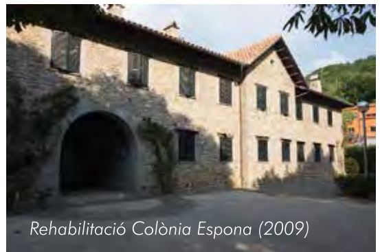
Rehabilitació Colònia Espona (2009)