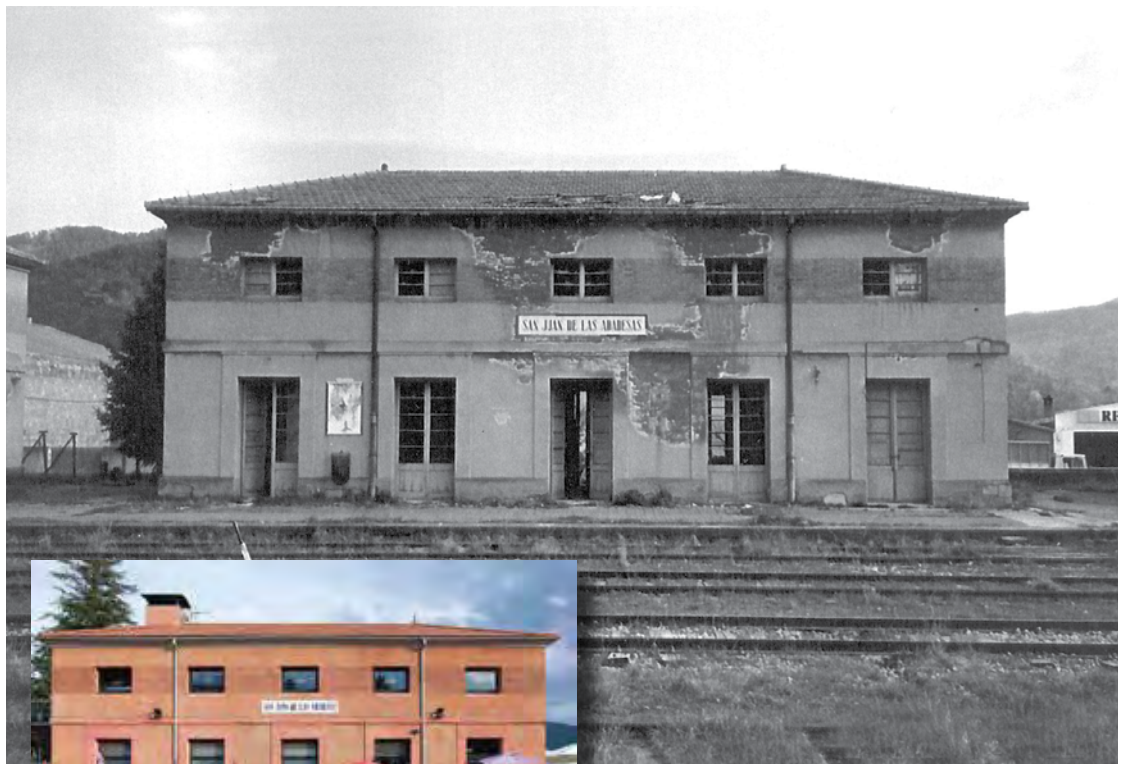
Ruta del Ferro (1996-1998)

"(...) L'Ajuntament actual -legislatura 83/87-, assumint plenament la gran responsabilitat de salvaguardar i millorar l'urbanisme de què gaudeix la vila i de planificar i programar el seu creixement, ha procedit a l'execució de la revisió del Pla General d'Ordenació Urbana del terme municipal, mitjançant la contractació de l'equip redactor, elegit per a la gran i transcendent tasca que requereix l'estudi i treball d'ordenament del nostre territori municipal.